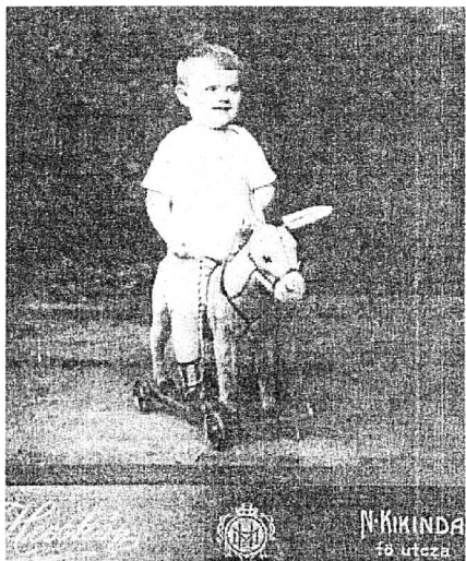
Régi korok fotói (Szöveg a 6. oldalon)