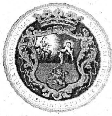
A város címere

A képek alsó régiójában, a földi szférában, Szent Teréz láthatjuk karmelita ruhában, térdre esve cellájában, elragadtatásának pillanatában, mely – a legenda szerint – 1559-ben következett be. A körülötte levő tárgyak, a papír, a könyvek írói munkásságára és bölcsességre utalnak. A koponya és az oszor szerzetességének és vezeklésének